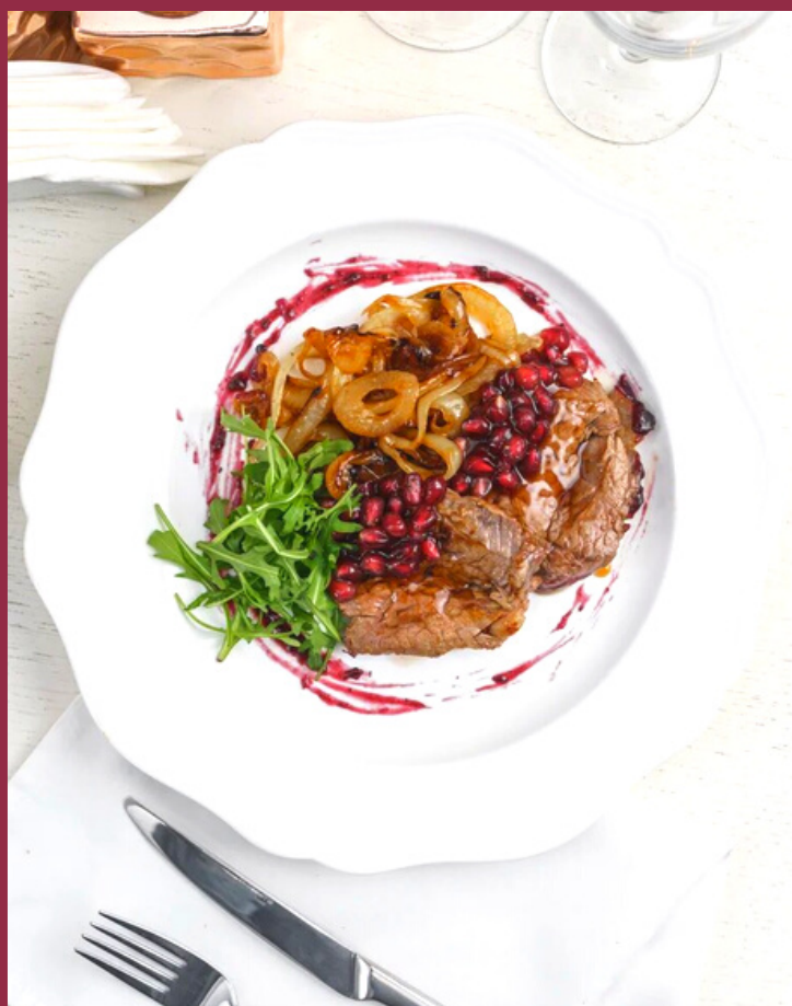
ТЕЛЯТИНА-МИНЬОН С ЗЕРНАМИ СВЕЖЕГО ГРАНАТА И ТОМЛЕННЫМ ЛУКОМ