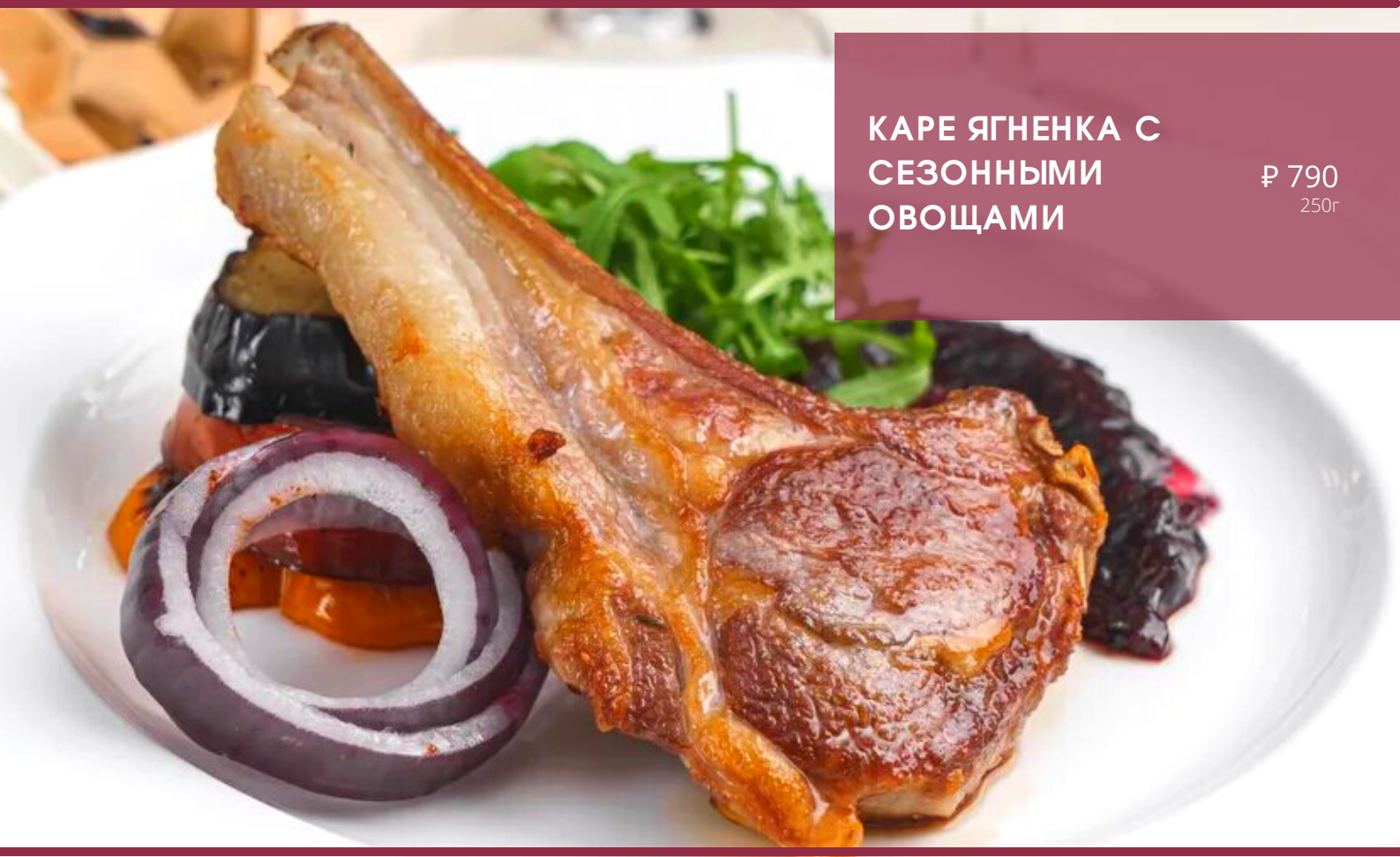
КАРЕ ЯГНЕНКА С СЕЗОННЫМИ ОВОЩАМИ