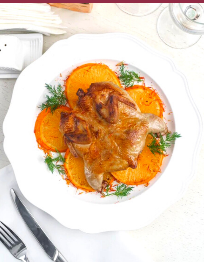
ПЕРЕПЕЛ ГРИЛЬ НА ЦИТРУСОВОЙ ПОДУШКЕ