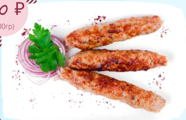
Колбаска куриная на косточке