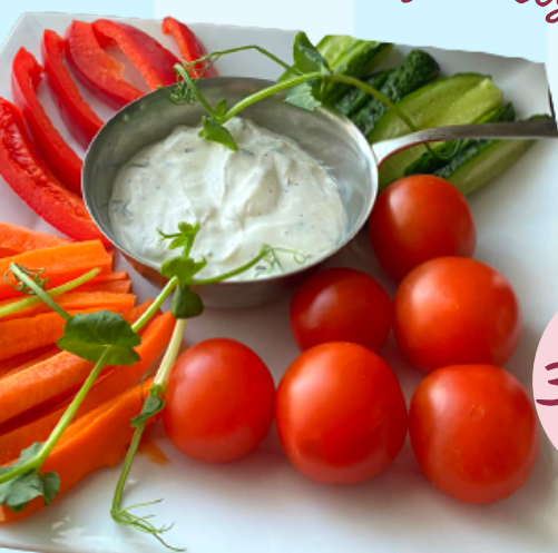
Свежие овощи с соусом