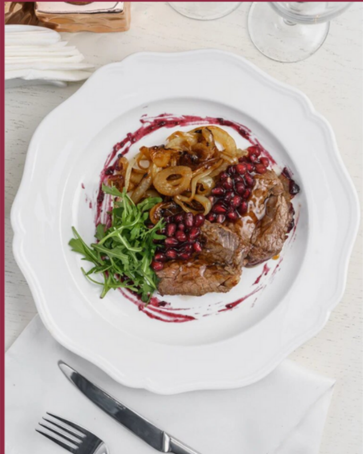
ТЕЛЯТИНА-МИНЬОН С ЗЕРНАМИ СВЕЖЕГО ГРАНАТА И ТОМЛЕННЫМ ЛУКОМ