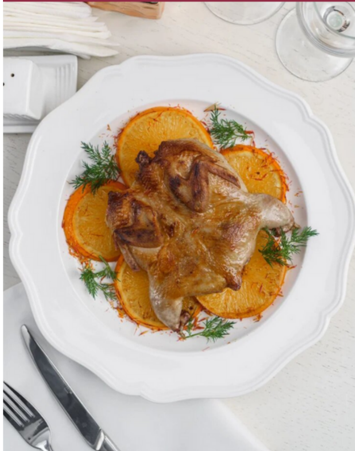
ПЕРЕПЕЛ ГРИЛЬ НА ЦИТРУСОВОЙ ПОДУШКЕ