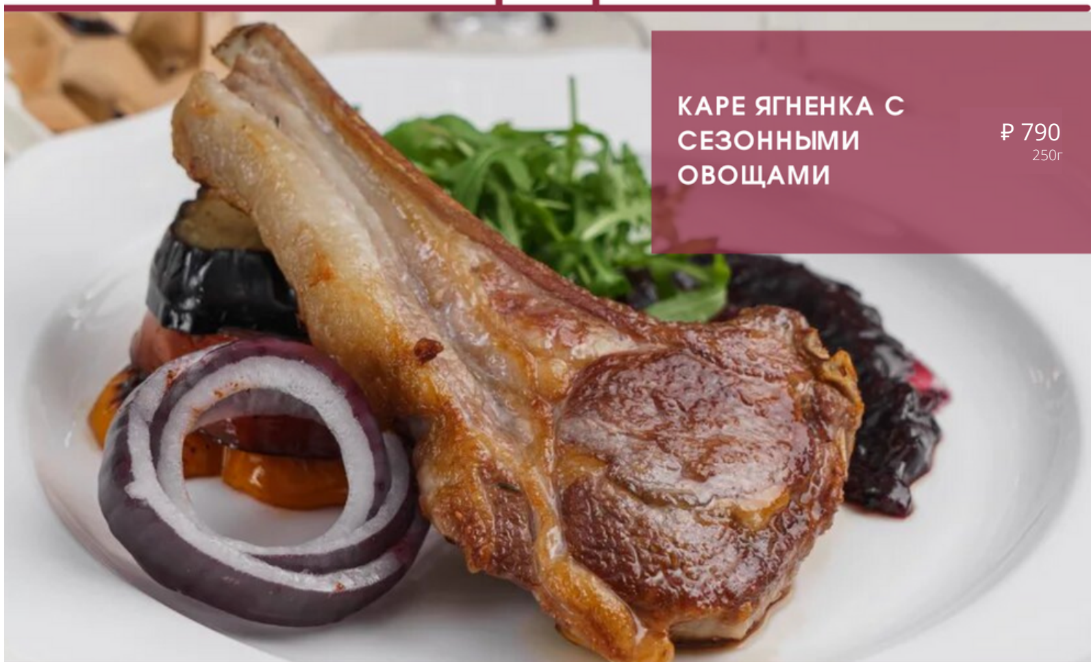
КАРЕ ЯГНЕНКА С СЕЗОННЫМИ ОВОЩАМИ